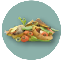
épluchures de fruits et de légumes