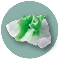
serviettes et mouchoirs en papier