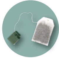
sachets de thé