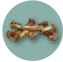
Petit os en petite quantité