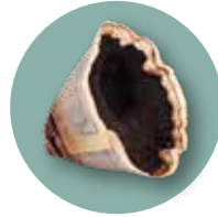
filtre à café et marc de café