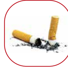
mégots de cigarettes