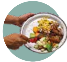
restes de repas