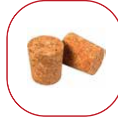
bouchons de liège